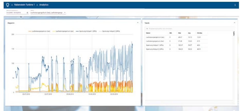
Bild 3: Ein Dashboard liefert in Echtzeit eine Gesamtübersicht über die Rabenstein-Turbine 1, wobei die Daten von Sensoren und virtuellen Sensoren sowie die Restlebensdauer dargestellt werden.

wählt, die sich im Verstellmechanismus des Turbinenlaufrades befindet.