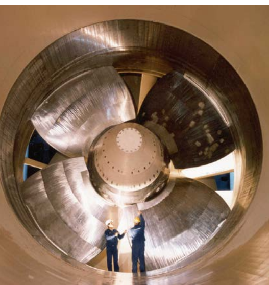
Bild 4: Simulationsbasierte Digitale Zwillinge sind am sinnvollsten dort einsetzbar, wo Komponenten variierenden, im Vorfeld unbekanntem Belastungen ausgesetzt sind.

Maßnahmen lassen sich frühzeitig initiieren. Für die Analyse können individuell definierte Zeiträume und Metriken betrachtet werden, um die ausgewählten Daten in grafischer oder tabellarischer Form darzustellen. So lassen sich spezielle Korrelationen verschiedener Daten selbstständig wählen.