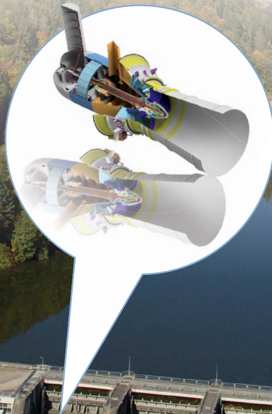
Bild 1: Für die Pilotanwendung wurde das Kraftwerk Rabenstein an der Mur (Steiermark) ausgewählt.

Das Wasserkraftwerk von morgen wird ein „gläsernes Kraftwerk“ sein. Und zwar in dem Sinne, dass möglichst sekundengenau und kontinuierlich umfassende detaillierte Kenntnisse über den jeweils aktuellen und den zu erwartenden Anlagenzustand vorliegen. Diese Zielvorstellung will die VERBUND Hydro Power GmbH (VHP) – eines der großen europäischen Wasserkraftunternehmen – zukünftig mit Digitalen Zwillingen und virtuellen Sensoren erreichen.