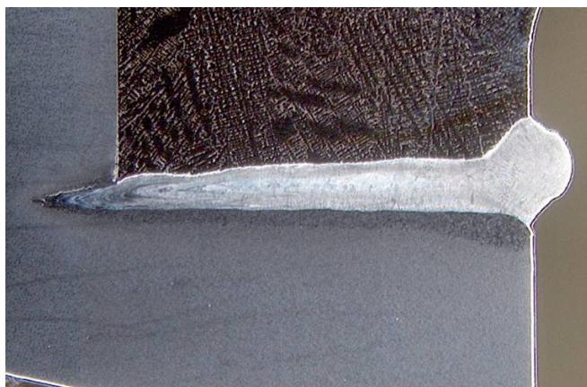
Abb. 2: Schliffbild durch die Schweißnaht.

Das FEM-Modell wurde für den Sektor mit dem Anfangs- und Endbereich der Naht erstellt. Als erster Berechnungsschritt wurde eine transiente Temperaturfeldberechnung durchgeführt, wobei der Elektronenstrahl durch eine Ersatzwärmequelle abgebildet wurde. Daran anschließend wurde eine mechanische Spannungsanalyse mit plastischem Materialverhalten berechnet. Am Schweißspalt wurde die Verbindung der Nahtufer über eine temperaturabhängige Verbindung idealisiert. Für den Anwender wurden Erläuterungen erstellt, damit Varianten der Prozessführung in Eigenregie untersucht werden können.