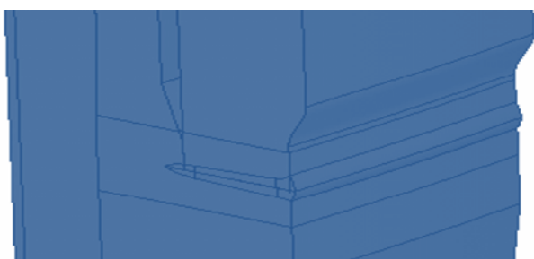
Abb. 3: Geometriemodell der Schweißnaht.