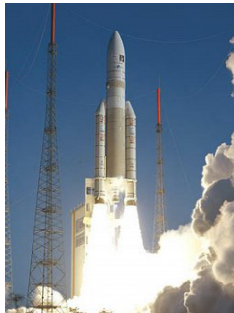
Abb. 1: Ariane 5.